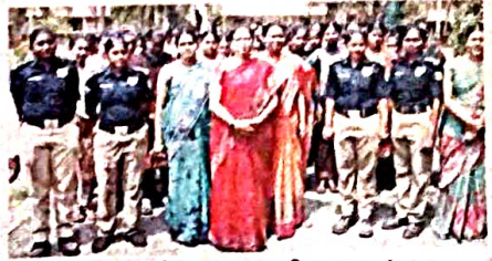
ప్రదర్శనలో పాల్గొన్న శక్తి బృంద సభ్యులు