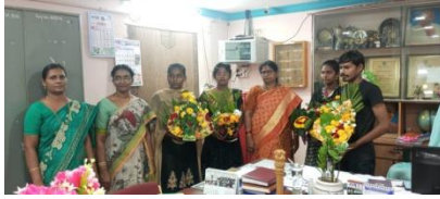
46 th Annual day celebrations at GDC,Avanigadda on 26 th Aprl.